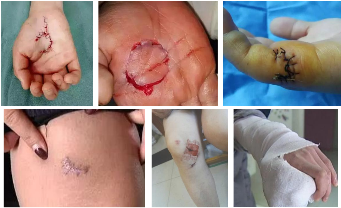
图 7 被薄壁金属管刺伤的伤害示例