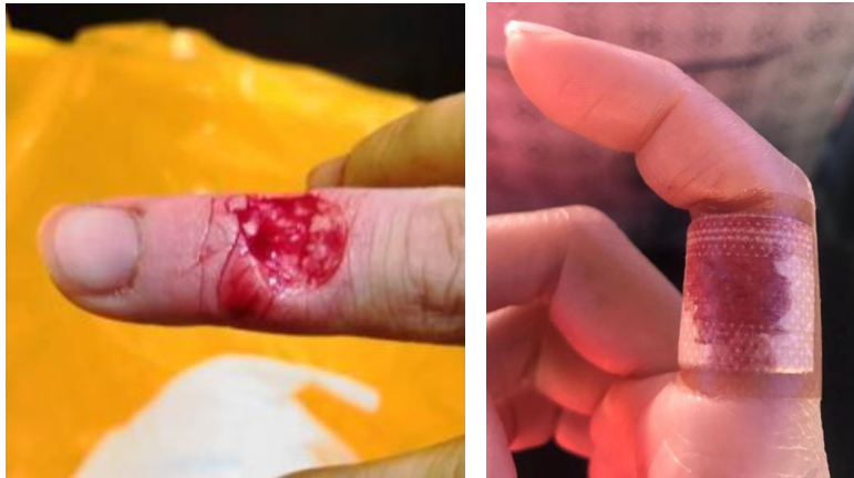
图 5 被锐边划伤的伤害示例

塑料把手通常采用注塑工艺，经注塑成型的塑料把手在高温下仍有一定的弹性变形余量。将注塑后的塑料把手套在壁厚为 0.3mm 左右的金属把杆上，当塑料把手温度下降至室温后，塑料把手冷缩在金属把杆上成为把手组件。由于结构设计、材料选用、工艺参数等因素的影响，不同厂家生产的塑料把手与金属把杆之间的连接力表现出千差万别的结果。