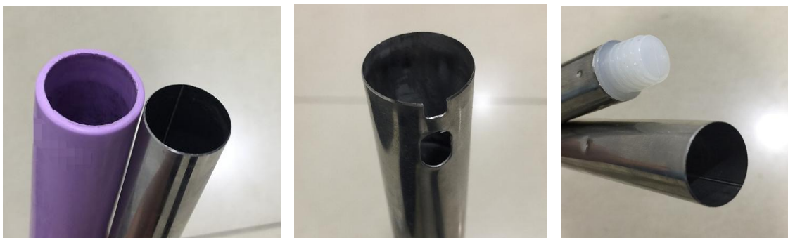
图 4 含锐边的可拆卸零部件