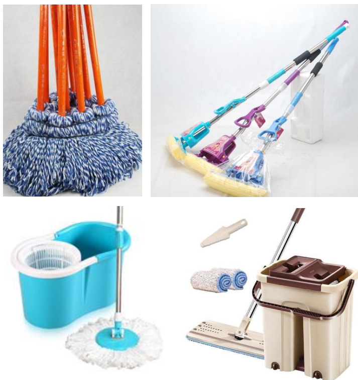
图 1 拖把示例

拖把，俗称拖布、墩布，通常用于清洁地面。按结构设计分类，常见的种类有：木杆拖把、胶棉拖把、旋转拖把、平底拖把等。