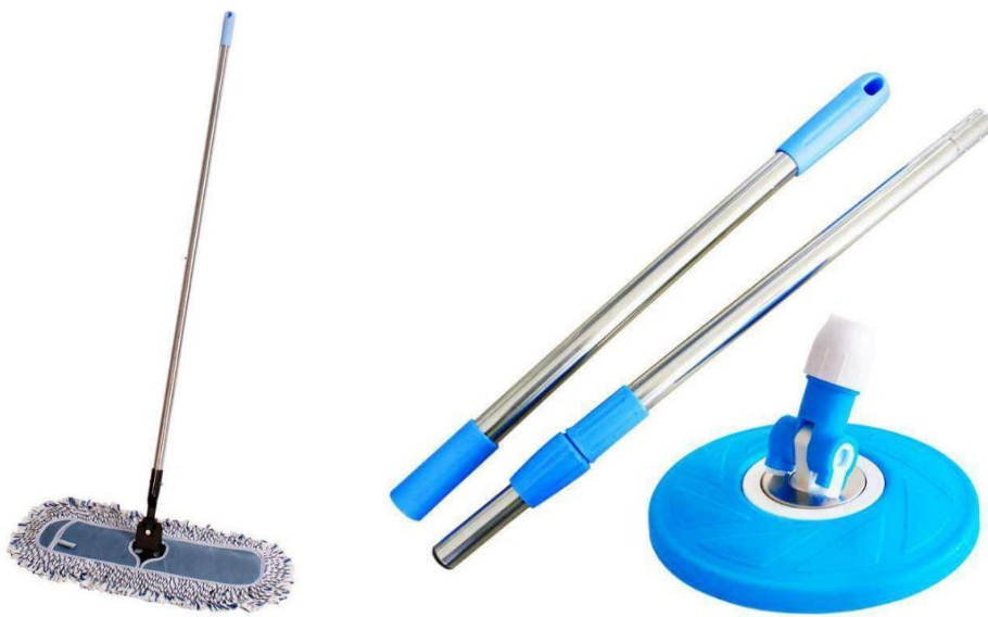
图 3 全尺寸金属把杆及组合式金属把杆

金属杆拖把及扫把的把手设计通常采用将塑料把手套在金属把杆上，仅靠塑料与金属件的摩擦力保证连接的可靠性，并无其他固定措施。组合式金属杆的可拆卸零部件通常通过螺纹旋接或卡扣嵌套的方式进行连接。