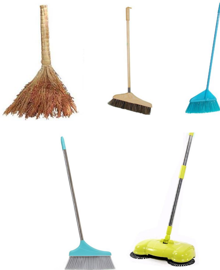
图 2 扫把示例

扫把，俗称扫帚，通常用于清洁地面。按把杆材质分类，常见的有：高粱杆扫把、木杆扫把、塑料杆扫把、金属杆扫把等。