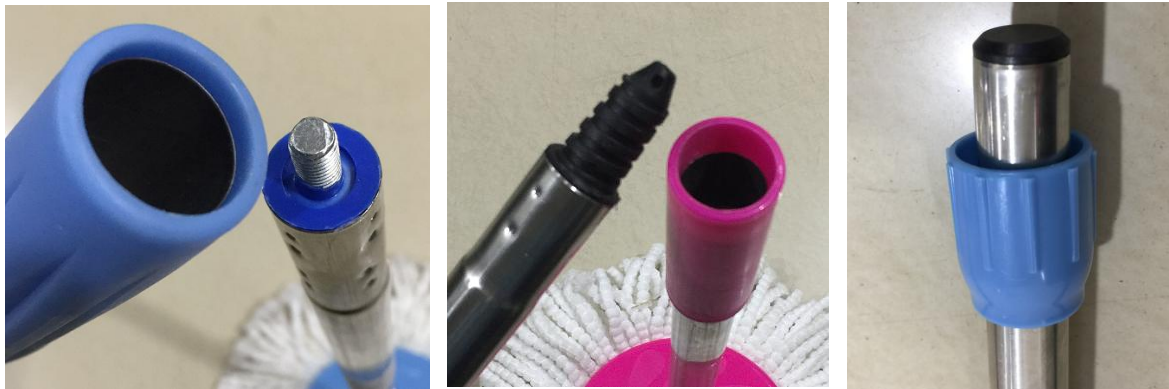
图 8 锐边被包覆或填充的可拆卸零部件